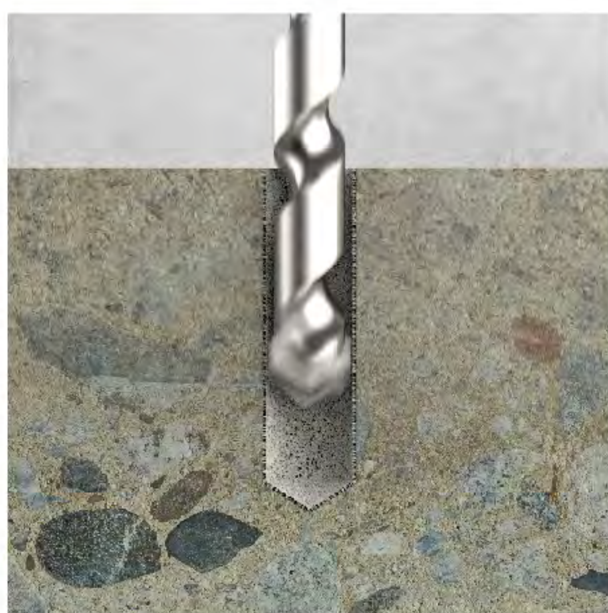
1. เจาะรูตามขนาดที่กำหนด