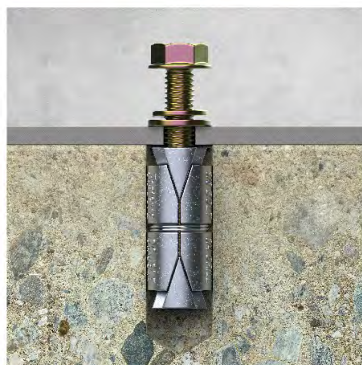
5. ใส่ แหวน และ แหวนสปริง และน็อตลงไปทีปลั๊ก