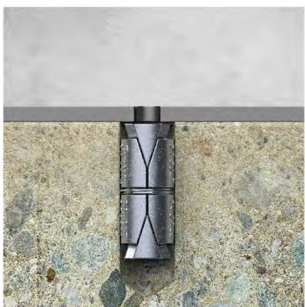
4. วางวัตถุที่ต้องการติดตั้ง