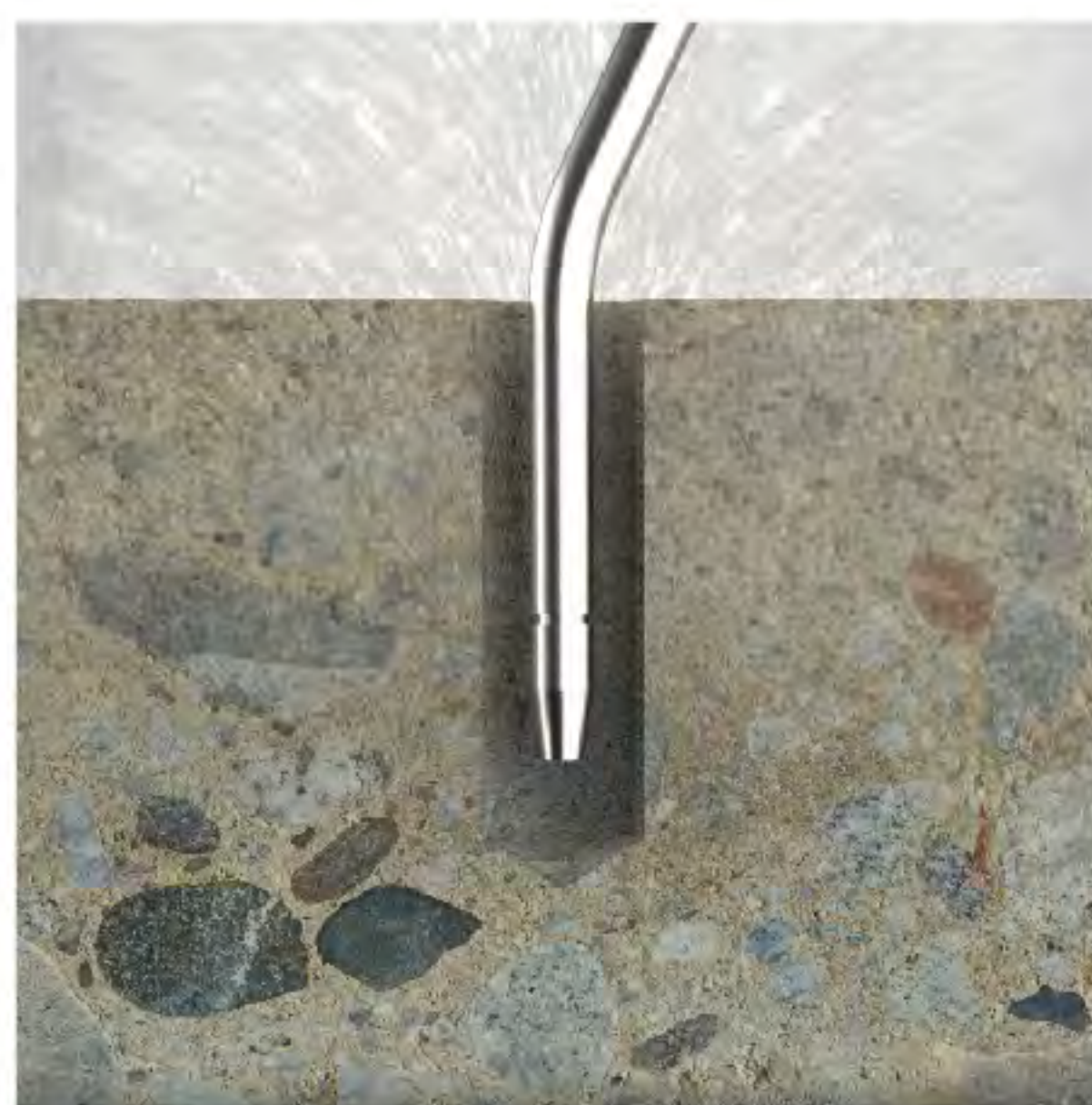
2. ทำความสะอาดรูเจาะ ด้วยการ เป่า และ ดูด