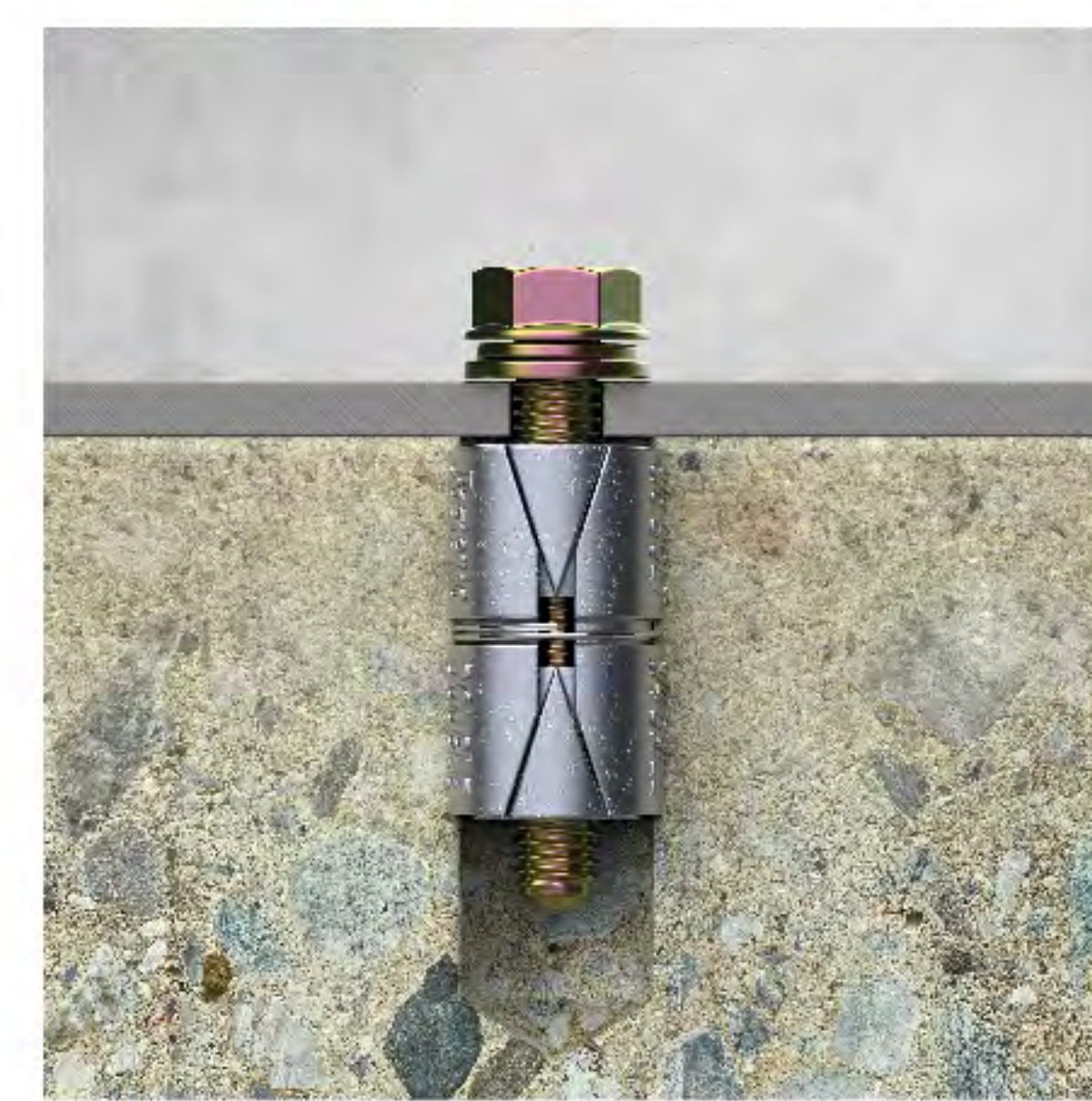
6. ขันน็อตลงไป ให้ได้ค่า Torque ที่กำหนด ปลั๊กจะยึดแน่นกับรู