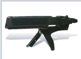
ชื่อ Extrusion - 400