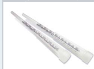
ชื่อ Mixer - 400