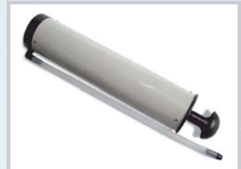
ชื่อ Dust Blower