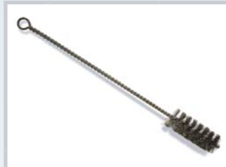
ชื่อ Cleaning brush